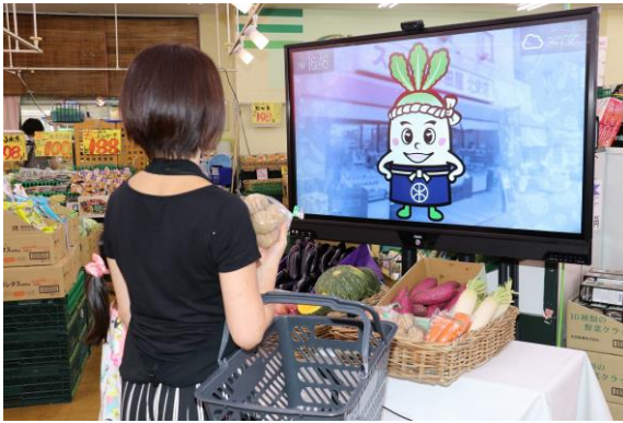
アバターによる接客販売